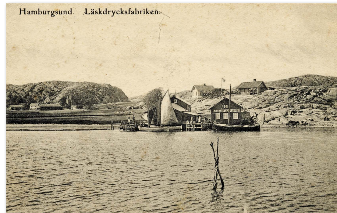
Uppe i berget syns "Kalle och Frida på Bergets" hus och till höger Nordbloms bank. Underst konserv- och läskedrycksfabriken. Vykort stämplat 1909.