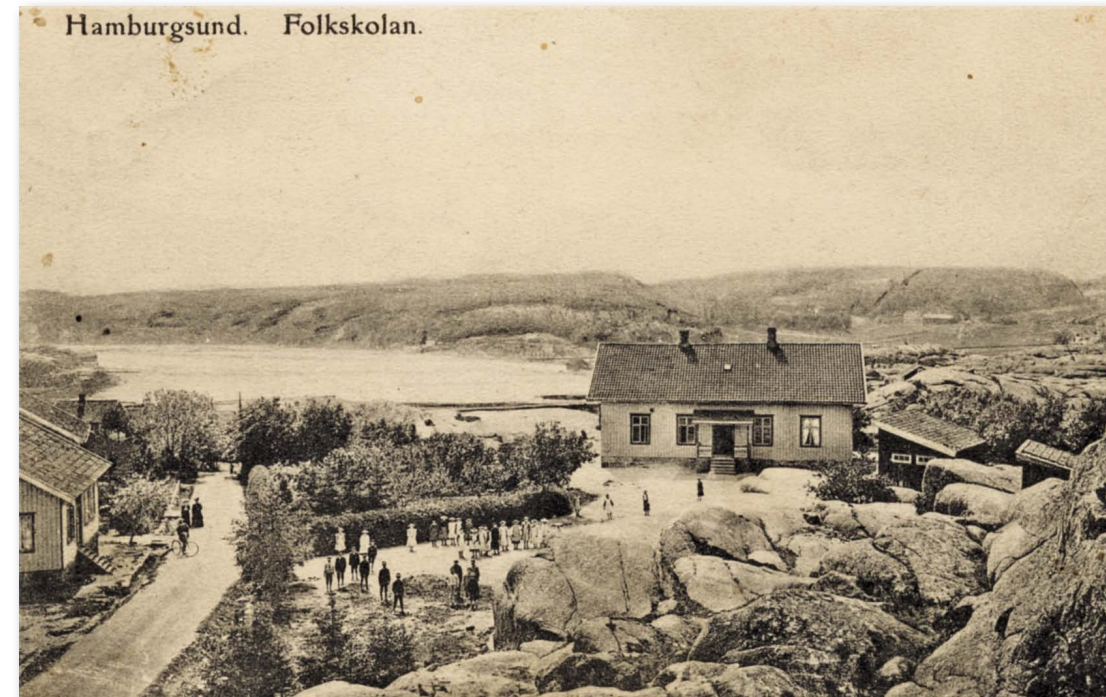
Uddens skola – gamla folkskolan i Hamburgsund. Numera förskola. Vykort stämplat 1906.