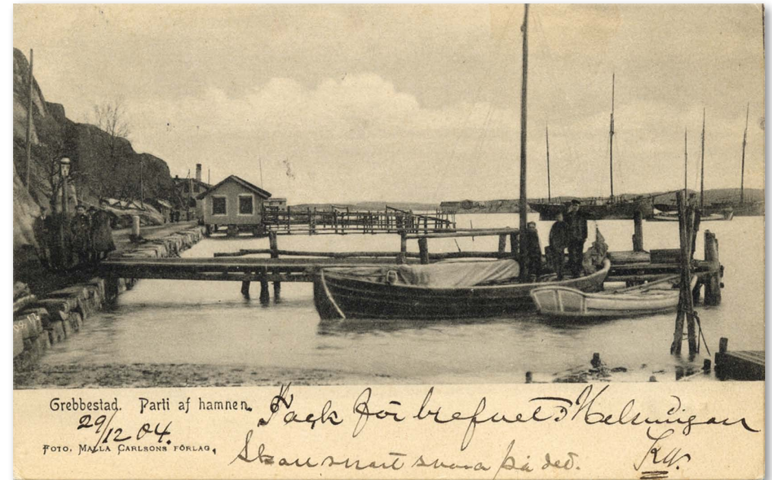
Hamnen med gamla kallbadhusen i bakgrunden. En garnbåt med en norsk kantig eka ligger vid bryggan. Brevkort stämplat 1904.