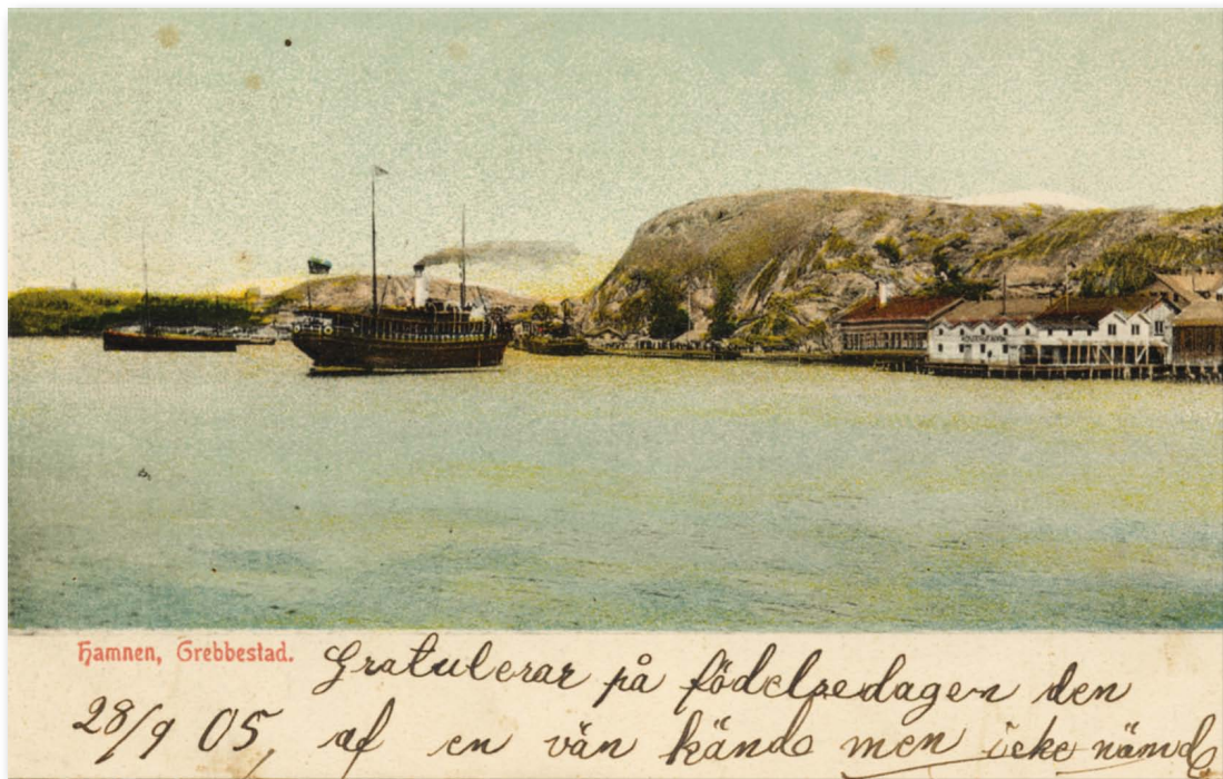
Handkolorerat brevkort med varmbadhuset och en ångare. Brevkort stämplat 1905. Ångaren på bilden är troligen "Oslo" som trafikerade Grebbestad och var mörk till färgen.